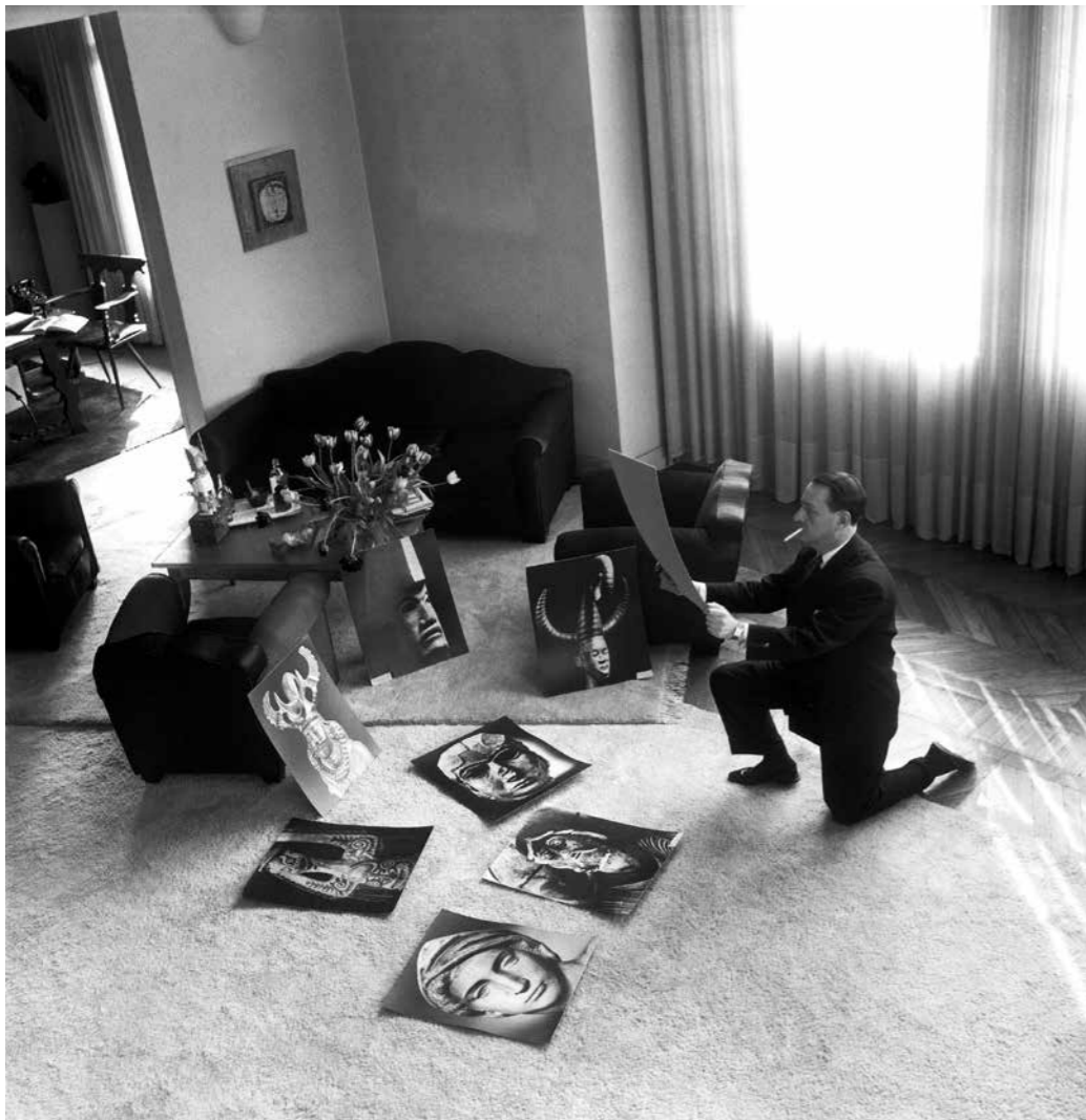
△ André Malraux à son domicile, préparant la publication du second tome du Musée imaginaire de la sculpture mondiale , 1953.

en lumière. Pour une œuvre, même quand son contexte d'origine est tout à fait quotidien, le fait de l'en sortir, de l'éclairer d'une certaine manière, exerce une forme de métamorphose qui rend son histoire intéressante. De nos jours, la difficulté est de montrer cette pluralité d'identités d'un objet. Un musée n'est pas là pour imposer une vérité. Il ouvre les portes à différentes sensibilités qui permettent à chacun d'exercer un décentrement par rapport à sa propre culture. Il faut aménager des temps et des espaces qui le permettent.